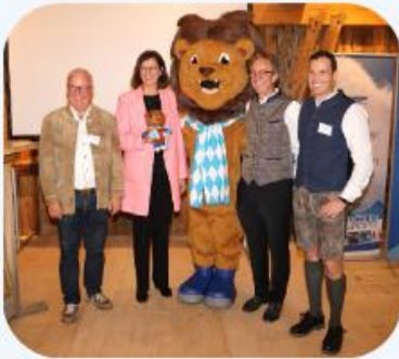
Interessensvertretung auf nationaler, regionaler und lokaler Ebene