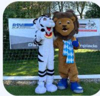
Service, Beratung & Kooperationen innerhalb der Wintersport-Community