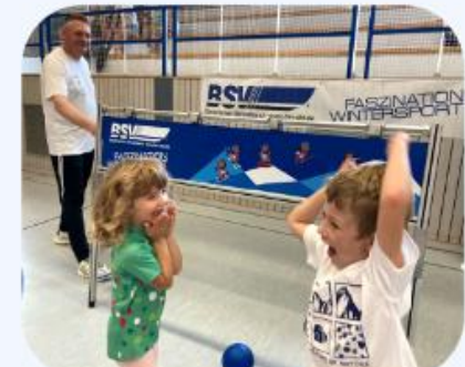
Konzeptionelle & operative Unterstützung für Vereine im Breitensport